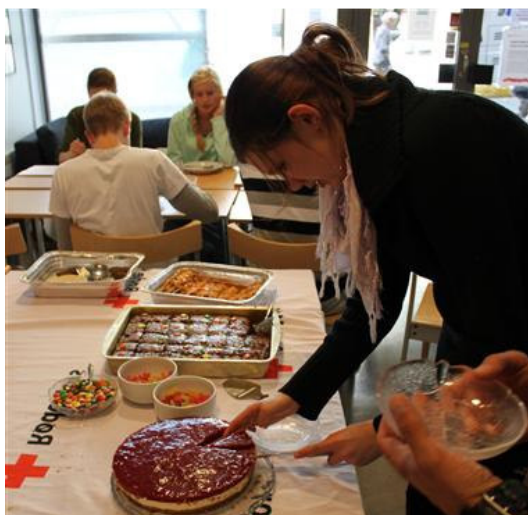
Litt kake fortjener man etter å ha brukt to uker av ferien på skolebenken – og ikke minst etter en vel overstått eksamen...