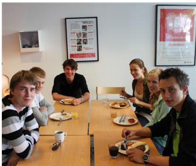
Elevene var ikke bare godt fornøyde med undervisningen, men også med maten. Den ble forøvrig levert av Askøy Røde Kors sitt eget cateringfirma.