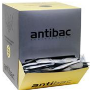
Antibac 85% våtservietter

Bildet kan ikke vises. Datamaskinen har kanskje ikke nok plass til å åpne bildet, eller bildet kan være ødelagt. Start datamaskinen på nytt, og åpne deretter filen på nytt. Hvis rett i forsteget vises, vil du kanskje måtte tilbøye og deretter sette det inn på nytt.