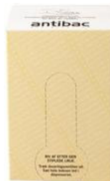
Hånddesinfeksjon Antibac 85%